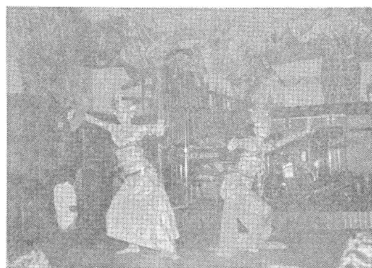
写真6 さよならパーティーでのバリ踊り

第2日の晩にさよならパーティーが催された。案内状には男性は長袖のパチック着用のことと書かれている。いかにもお国柄らしく、これが男子の正装とのこと。開会の挨拶につづくグループサウンズの真白き富士の根によって幕が開かれる。つぎつぎと日本の歌謡曲がつづき、最後はみよ東海の空あけて……と特別のサービス振りである。