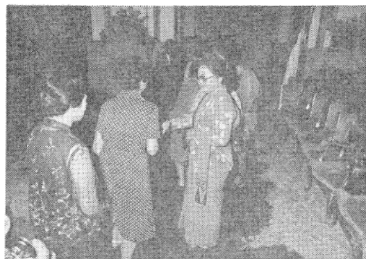
写真5 調見をうけるスハルト大統領婦人

会期中の2日間、レディスプログラムが別に組まれていた。ジャワ更紗(パチック)のロングスカートに、共切れのたすきで正装したインドネシア婦人に混って、各国の婦人が参加した。彼女たちは、まず大統領官邸に招かれてスハルト大統領婦人の接待をうけ、邸内に設けられたステージで繰り広げられる民族舞踊やスマトラ島の伝統的な結婚の儀式を觀賞した。つづいて市内観光、パチック工場、最後にはショッピングに案内された。