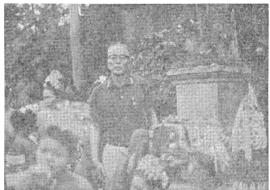
写真8 バリ島娘に囲まれた筆者

バスに乗って金銀細工の村、彫刻の村、絵画の村をショッピングをかねてつぎつぎと見てまわる。バリ島の人たちは誰もが芸術家といった感じさえうける位に、村の名所で熱心に作業している姿がみられる。木彫の店には奇怪な形相の像、神話に題をとった皇子と王女、神に祈る女性像、農夫など、古典様式のものから現代風のものまでいろいろ飾られている。黒たんやチーク材からでき、きめの細かい細工がほどこされていて、どれも安い。