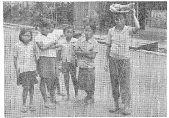
写真9 バリ島の子供たち

名所キンタマーニは白煙をあげるバツ山を中心にした高原地帯である。カルデラ湖をみおろせる休憩所で昼食をとりながら雲の切れるの