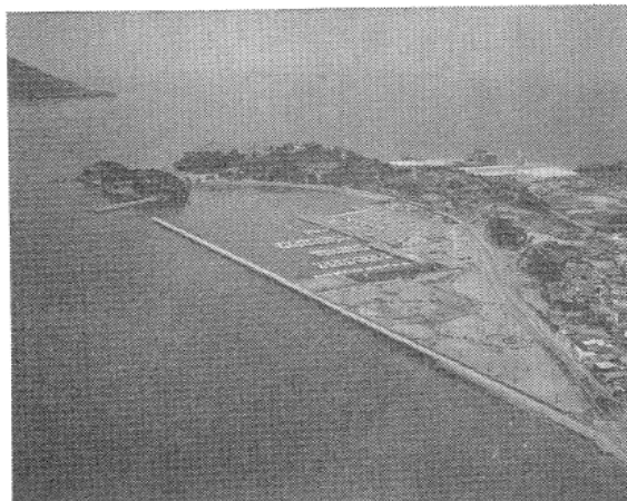
写真⑨ 小戸ヨットハーバー

越波実験／越波量などの資料収集 安定実験／構造物の安定度の実験 洗堀実験／洗堀沈下に関する実験 遮蔽実験／港の遮蔽実験など 漂砂実験／埋没・浸食への対策 汚濁実験／港湾・海岸の汚濁実験