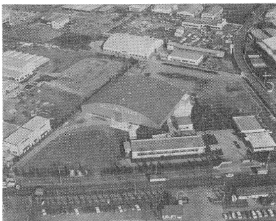
写真⑧ 土浦技術センター

々の役割を果たしてきました。将来も大規模な港湾・海洋の整備計画、厳しい海象条件下での海洋構造物の建設等の課題に応えるべく、日夜努力を重ねています。