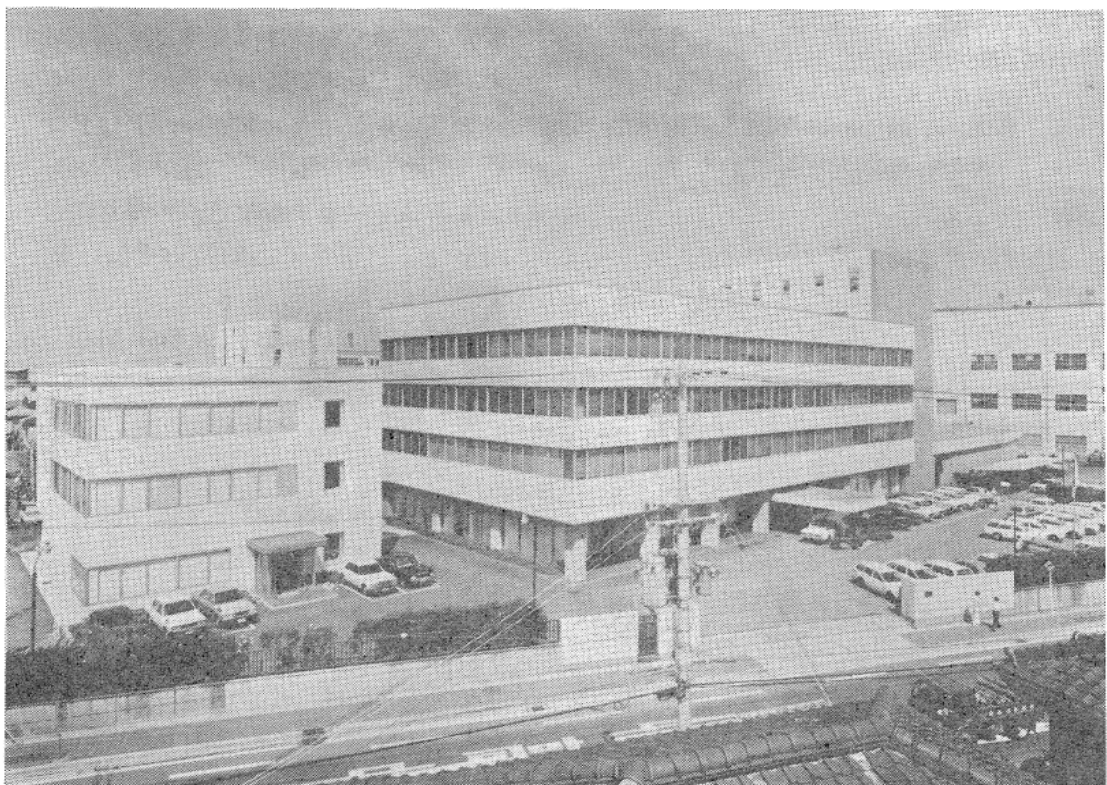
凸版印刷株式会社関西支社