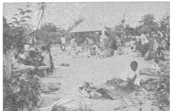
写真2 ポートモレスビーの一角コキの市場にて