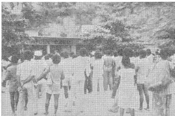
写真1 街角でテレビに見入る人々

市場で人々が缶詰でない、土のついた野菜や目をむいた魚を買っている。しかし、ちょっと車で走ればもう缶詰だらけの店が並ぶ。はだして歩く子供、男、女。しかし、にくいほどきまった腕輪や入れ墨がかれの動きを生あるものに感じさせる。