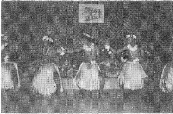
写真2 ガダルカナルのホテルのショーに出演するキリバスの若者たち

音楽と密接な関係をもつ舞踊にしても同じである。身体の動き、身体部分が作りあげる形象の世界は、同じ人間がやることなのだからそれほど違うことはないだろうと考えられがちであるが、所かわれば品かわるもので、同じ動作をしても表現された内容、受けとめ方が違うことの方が多いようである。