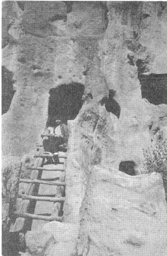
写真3 山の中腹にある700年前のインディアンの洞穴住居跡

力と思われるが、文化的にはスペイン人と共にニューメキシコ州を代表する民族である。アルバカーキ国際空港、ニューメキシコ大学を始めとし、住居の1/3位はインディアン独特の土の家（プエブロスタイル）である。但し、これは白人が住んでいるので、外観のみインディアンの伝統を残し、内部は一般のレンガ作りの家と同じである。州内では年中どこかでインディアンの祭が開かれている。最大のもは8月にギャ