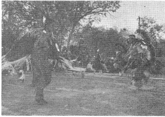
写真2 ステート・フェアでのインディアンの踊り