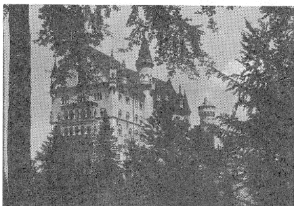
図4 ノイシュバンシュタイン城

のルドウィッヒ二世（1846～1886）が王位を継いだ。若い王は国費を傾けて、楽聖ワグナーの庇護にかけた。債鬼に追われて行方をくらましていたワグナーを探し出し、借金払いのもとより、大臣以上の給与で召しかかえ、ワグナーが死ぬ時（1883年）まで面倒をみてやるのであった。その上美しい城を、三つも建築した。リンダーホッフ、ヘレンキムゼー、ノイ・シュバンシュタインがそれらである。後の二つは、ルドウィッヒ存命中には完成に至らなかった。とくに、ノイ・シュバンシュタイン城は、ワグナーの楽劇に題材をとった壁画や、ローエングリーンの白鳥の置物などのある美しい城で、城山と紺碧の湖フォルゲンゼーの眺めはすばらしい。