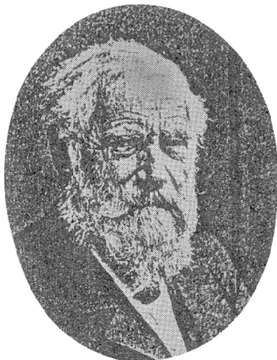
図5 マクス・フォン・ペッテンコーフェル

昭和56年(1981)のこと、茨城大学の中川先生達の調査(当時の横浜週刊英字新聞の船客名簿)で、やっと上記のことが分った。さらに同じ年、金山氏らによって、エリスの船旅の詳細が、明らかになった。エリスは、鷗外の出国より4日も早く、ドイツのブレーメンを発し、香港で船を乗りかえて、横浜にきている。しかも香港の当時の英字新聞には、Wiegert ではなく、Elise Weigert と記されている。このころの英字新聞の綴字の信頼性は、横浜より香港の