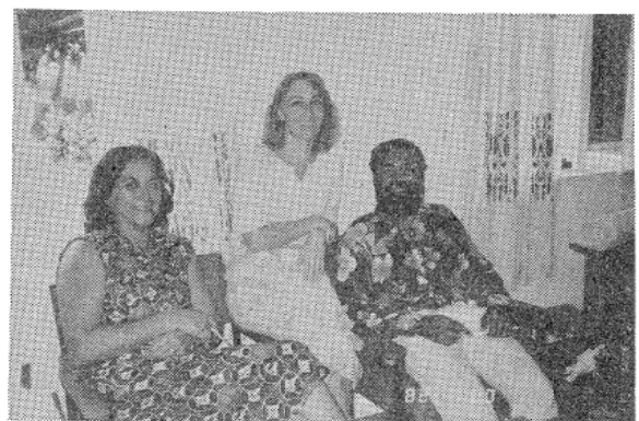
写真3 南太平洋大学 (USP) の拡大奉仕部にて

表からわかるように女性の指導者は約4分の1で、男性と対等であるとはいえないけれども、他地域の大学(たとえば日本)とくらべれば非常に進歩的といつてよいだろう。そういえば、グァム大学の学長も女性である。