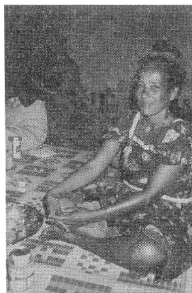
写真1 ミクロネシアの伝統的な夜の集会でのボナベの女性

ほとんど島毎に言語や習慣を異にするオセアニアでは純粋に自律的な国家を作るのが困難でそのために小さな国々が次々と独立する現在にあっても相互に依存する連帯意識が強くはたらいっている。たとえば教育を例にとるなら、初等・中等教育は自国（自地域）で充実させるべく努力は払っているものの、大学等の高等教育ともなると、それは不可能に近い。そこでかれらは協力しあって南太平洋大学 University of the South Pacific というものを創設した。ミニ国連大学ともいえる USP は文字通り南太平洋全域の住民の高等教育を目的として、本部をフィジーにおき、センターと称する分校をできるだけ多くの島に設置するという方針をとっている。そしてそれぞれのセンターが独自の方式で地域のサービスに力を注いでいるのである。こ