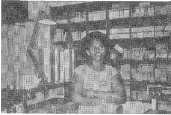
写真2 南太平洋大学 (USP) の拡大奉仕部で通信衛星による放送施設で働く女性