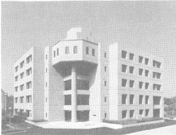
電子制御機械工学科の建物(機械系D棟)