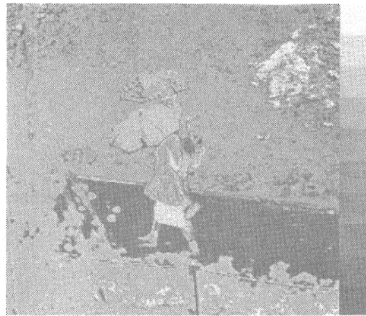
図3 道路領域の候補