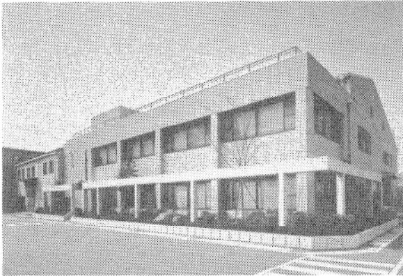
十三技術センター