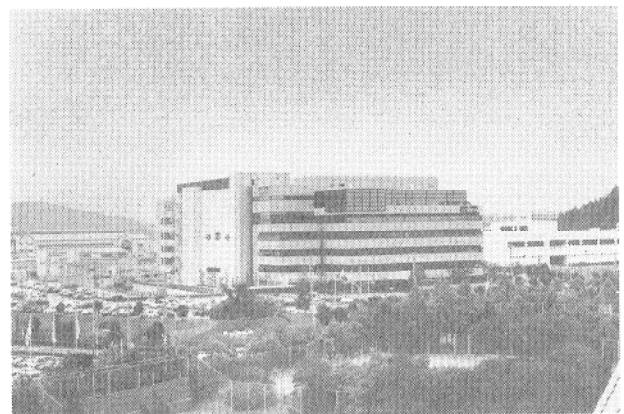
ホンデン R&D センター

AV機器関連部品では、音響の標準となる標準マイクロホンや高齢化社会に対応したデジタル補聴器用イヤホン/マグネチックレシーバー、騒音環境下での使用に対応する骨伝導イヤーマイクロホン、振動ピックアップマイクロホンを開発しました。その他、防滴マイク、ワイヤレス化ニーズに対応するコードレスヘッドホンシステム、コードレスインターフェース用赤外線送受信機、JEIDA対応DRAMカード用コネクタ、PCMCIA対応I/Oカードコネクタ、ウイックプッシュスイッチ、小型レコグニションスイッチ、小型トラックボールなどを開発し、商品化しました。また、自動車・FA関連部品としてNSコネクタ、アウトレットソケット、ハンズフリースピーカ、ハンズフリーマイク、車