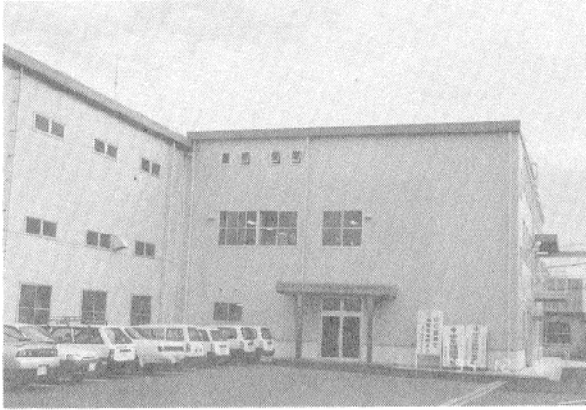
本 社 工 場