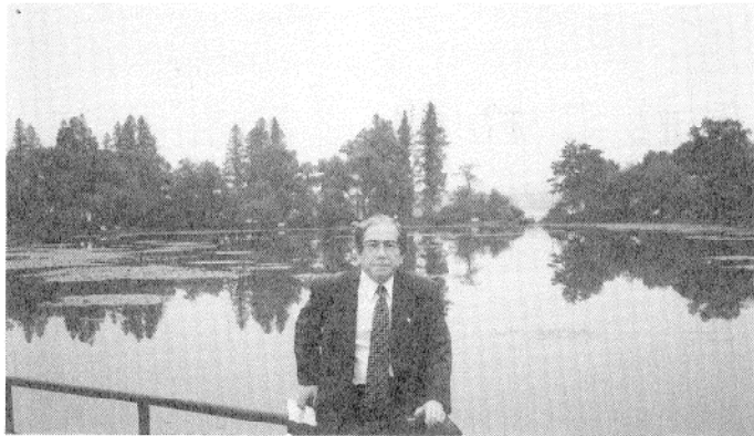
西湖の風景、直径3.5km短径2.5kmの西湖の真中に“三潭印月”と呼ぶ島があり、その島の中に4つの池がある。日本で云う田毎 タゴト の月よろしく、島の真中に立つと3つの池に月が3つ映るところからこの名がついている。

仕事をして下さった。現在は、上海大学材料科学系主任のほか、中国太陽エネルギー学会光電変換部門長をも務められ、云わば当浜川研究室出身の外人研究者の出世頭の一人である。