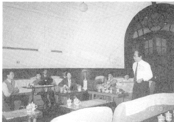
上海科学会堂での中国太陽エネルギー学会、太陽光発電部門委員会での講演一場面。

大阪大学基礎工学部で浜川研究室と云う看板を掲げ、“半導体材料の電子物性とその応用デバイス”に関する研究に従事して25年余りになる。その間、手がけてきたテーマがシリコンからⅢ-V族の光半導体、透明強誘電体やアモルファス材料等と、仕事を進める内に新素材と呼ばれるものになった。それらの応用デバイスがオプトエレクトロニクスや太陽光発電の分野など、時代の最先端技術の開拓に関わったことから、比較的多くの外国人客員研究員や留学生のお世話をしてきた。ちなみに現在の在員をしらべてみると、ECフェローシップ、学振を含めて、独逸人1人、チェコ1人、タイ国人1人、中国人1人の4人の研究員、それに留学生がインドネシア、韓国、独逸の3人で合計7名が滞在中である。そして、年間を通じて20人を越える客員や留学生の申し込みがあり、最近滞費のみならず、研究費も自国持ちと云うプロポーザルさえある程で、研究室にお座り下さる机や椅子のスペースもないと云ってお断わりす