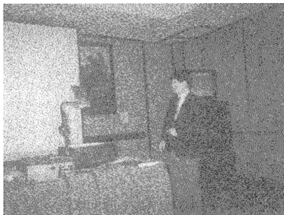
写真2 私の発表風景

のとおり話すことに無我夢中で、発表中に客席や自分自身がどうだったかはあまり覚えていません。気がつけば終わっていました。発表後に私の属する研究室で数年前に共同研究をしていた外人さんに、「良い発表だったよ。」と言われたことはいまだに記憶に鮮明に残っています。発表中の私を担当教官にカメラで撮ってもらった写真を写真2に示します。