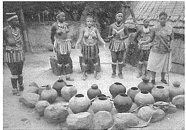
写真2 ズルー族の未婚の女性は体型に関係なく自分の身体を誇示するのが伝統。ビーズの飾りが美しい。色にも意味がある。

南アフリカからアパルトヘイトが公的に無くなったのも、わずか7年前である。ダーバン滞在中には意識しなかったこの問題も、ヨハネスブルグで感ずることがあった。過去、激しい虐待を受けた者の冷