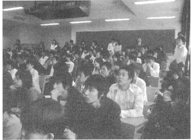
写真3 豊中キャンパスでの受講風景

がないので、スクリーンのある隣の部屋まで使うことになった。最終的に授業登録したのは165名であった。常に新しいことに挑戦するのが大学であるはずだが、先例主義の事務局との整合性に苦勞する。例えば、海外事務所は遠隔授業などの「教育」をやってはいけない。従って、講師謝礼も事務所経費から支給出来ない。結局交渉の末、本年度より海外事務所を教育研究センターとした。