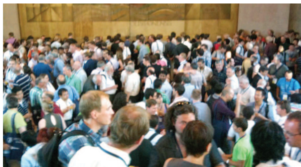
混雑するレセプションパーティ

ポルトガルのリスボンで行われた有機金属化学に関する国際会議 ICOMC2012 に参加しました。本国際会議は約半世紀の歴史を持ち、参加者が1000人を越える大規模な会議であり、世界各国の研究者と意見交換できる絶好の機会でした。私の発表は6日間の日程中の5日目であり、スライドを用いたショートトークを含むポスター発表を行いました。ポスター発表では世界各国の研究者から大変貴重な意見を頂きました。発表後の夜には学会が主催する夕食会に参加し、私は席が隣となったハンガリーの研究者の方と共にポルトガルのワインを楽しみました。本国際会議への参加を通し私は自身の研究成果を世界へ発信するだけでなく、世界中の研究者と交流する貴重な体験が出来ました。この経験を活かし世界で活躍できる研究者を目指して今後も研究に取り組みたいと思います。