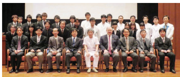
セミナー後の集合写真