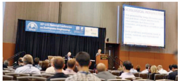
写真2 主題発表会場