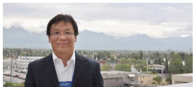
写真4 アンカレッジの山々を背景に

E-mail: li_yuebing@arch.eng.osaka-u.ac.jp