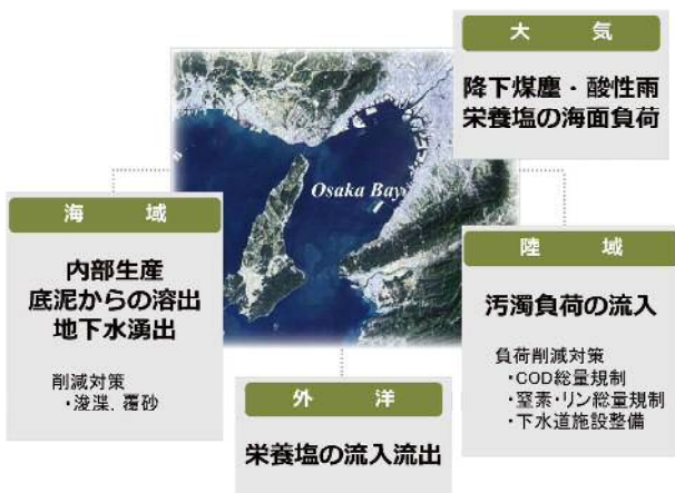
図1 水環境の影響因子と改善策