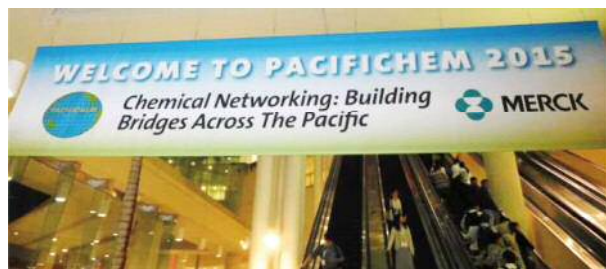
学会会場 (ハワイコンベンションセンター)

研究者との議論は、普段参加する分野ごとに区切られた会議では経験することのできない新鮮なものであり、大変有意義でした。今回の国際会議への参加を通して、私自身の研究成果を世界へ発信するのみでなく、世界中の研究者と交流する貴重な経験をすることができました。この経験を糧に、世界で活躍できる研究者を目指して今後も研究に邁進したいと思えます。