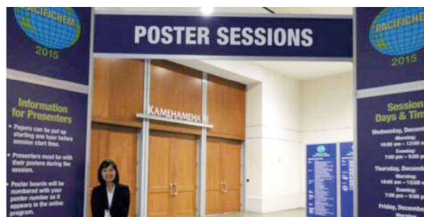
ポスター発表の会場前にて