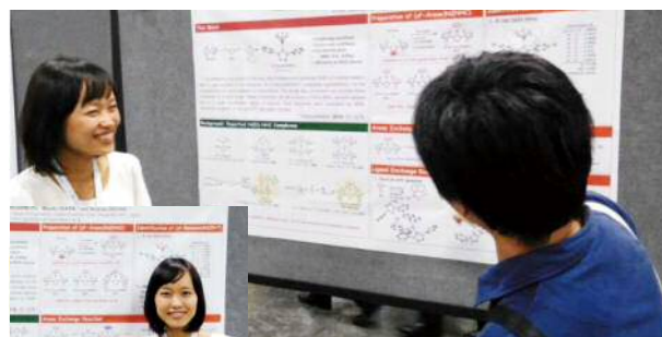
ポスター発表での議論