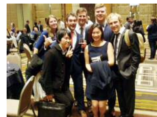
conference dinnerにて、メルボルン大学の学生さんと