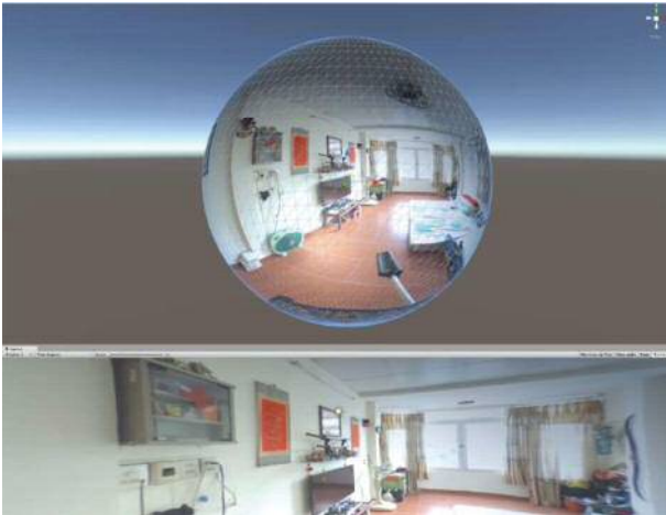
図3 仮想化現実環境の画像イメージ

QoL向上に貢献する人工物デザインを行う際に、住居を含む他の人工物との配置関係やユーザの動線など、空間情報が有用な場面がある。例えば、先進国企業が途上国に受け入れられる人工物デザインを実施する際、こうした空間情報は設計者が現地に赴かないと把握しにくい、製品開発コストやリードタイムの点で困難がある。