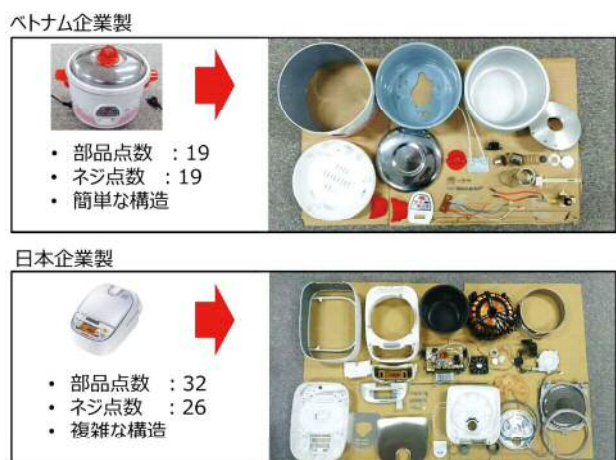
図2 炊飯器のテアダウン例

本研究では、現地調査、人工物の動作解析とテアダウンなどを通じて得た地域特有情報を人工物の機能・構造マップに対応付ける拡張機能・構造マップを提案し、設計支援への応用を研究している。これまでにベトナムやタイを実際に訪れて収集した情報を情報可視化システム上に表示したり、LCAや社会LCA評価をしたりして比較文化研究を進めている。図2は日本企業製とベトナム企業製の炊飯器のテアダウン例であるが、機能、構造、あるいは部品の加工や処理方法に地域性が反映されている。