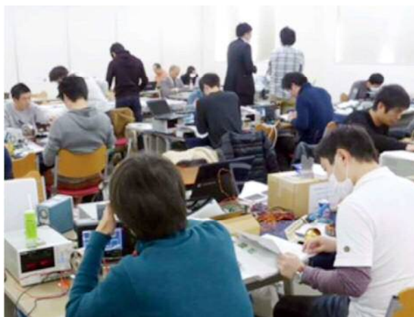
図2. “プロジェクト設計”におけるDC-DCコンバータの実習風景

製品の開発段階で観測される想定外の現象は幾つかの要因が組み合わさって発生していますが、それらの要因をイメージ化して頭の中で合成すれば結果を推定することができます。もし観測結果と推定値の間に大きな差があれば、その差を埋める仮説を立てて再び思考実験を行い、その結果を再び推定します。このような「仮説の構築と思考実験の繰り返し」をすれば観測結果の裏に隠れた物理現象の本質を捉える実力が付くはずで、この製品開発のプロセス（科学的な技術開発の方法）を会得することを目指します。