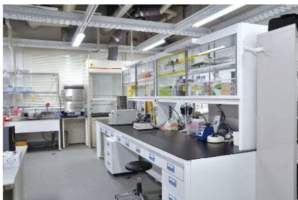
図4 5階の化学系のオープンラボの写真

阪大学安全衛生管理部と三進金属工業(株)が共同開発したフレームシステムを採用し、地震による機器の転倒・落下などを防ぐことができるようになっています。