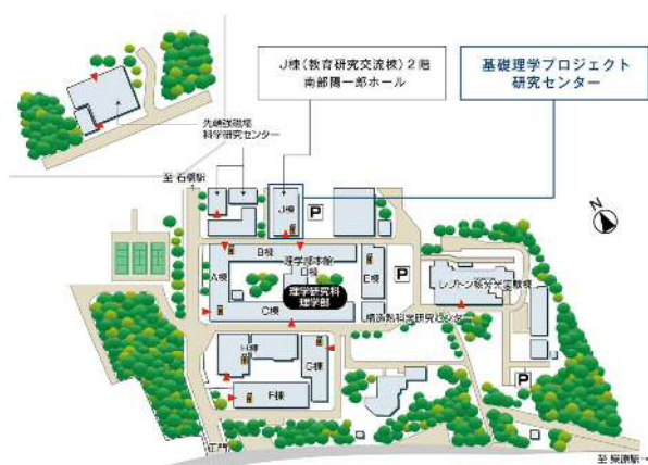
図1 理学研究科教育研究交流棟（理学J棟）周辺の地図

理学研究科教育研究交流棟（理学J棟）は、大阪大学理学研究科附属基礎理学プロジェクト研究センター本館（旧原子核実験施設本館）の耐震改築事業として、理学研究科と基礎工学研究科の間の工作センター跡地（図1）に新築され、平成29年1月末に竣工しました。同棟は、基礎科学における先端的研究を遂行するとともに、新規性と独創性を重視した分野横断型研究の創出・育成、およびこれらの研究に係わる産学官連携・国際連携に資することを目的に建設されたものです。一階にコンビニエンスストアが入っており、「コンビニの建物」ということで知られています。