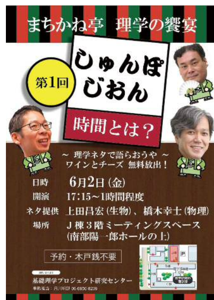
図5 第1回「しゅんぼじおん」のポスター

3階には、様々な分野の研究者が集って、自由にディスカッションを行えるオープンなスペースとして、70m 2 のミーティングスペースを設けています。PRCでは、このスペースを活用して、研究科内外の研究者(教職員や大学院生)や産業界の方々の研究交流を促し、分野を超えた広い視野に立って新しい理学のタネを生み出すイベントである「しゅんぼじおん」を毎月開催しています。「しゅんぼじおん」は、プラトンの「饗宴」のことで、「シンポジウム」の語源です。第1回目は「時間とは?」(図5)、第2回目は「カオスとは?」というお題について分野が全く異なる研究者が話題提供をし、ワインとチーズを片手にみんなで理学を語りました。