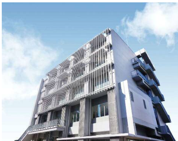
図2 教育研究交流棟の外観写真

オープンラボは、合計12部屋（約100m 2 が5部屋、約75m 2 が2部屋、約50m 2 が5部屋）あります。1階は、質量分析装置のような大型の実験装置が設置されています。4階は物理・生物系の実験室で、5階は化学系の実験室になっています。4、5階は、大