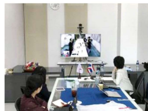
(TV会議システムの運用)

すでに、マヒドン大学教養学部の一角に、現地での教育・研究指導のため、TV会議システムを完備したセミナー室兼オフィス(ジョイント・キャンパス)が設置され、今年の3月には教員間の共同研究を推進するためにセミナーも開催されている。