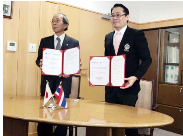
(大阪大学箕面キャンパスでの調印式)

そのなか、特にタイでは、学術交流協定校であるマヒドン大学に本学の微生物研究所や工学研究科のラボがあり、また、バイオテクノロジー分野でのダブルディグリープログラムもすでに動いていることから、いち早く、昨年12月に、現行の大学間学術交流協定のもとジョイント・キャンパス設置にかかる付属文書が取り交わされた。そして、それを受けて、今年の1月には相手側教養学部と本学大学院言語文化研究科とで、大阪大学においては、人文系プログラムとしては初めての例となる、応用言語学に関するダブルディグリープログラム（修士）協定が調印された。