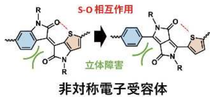
図2. 非対称 \pi 共役電子受容性基

有機太陽電池のバルクヘテロ接合は、p型とn型半導体の結晶相とアモルファス層、および多様な混合層の階層構造から構成され、これらの相の形成には半導体同士の相溶性に加え、半導体単独の結晶性と溶解性が重要な因子である。これらは、非対称構造を起源とする位置規則性を制御することで大きく変化させることができるが、統一的な因果関係は明らかではない。このような複雑系をひも解くには、TRMC法や各種分光法を駆使するだけでなく、系統的な材料合成も必要である。機能材料を合成する時、「作りたい構造」を先に考えて後から機能を検討するアプローチと、機能を発現・検討するために「作る必要のある構造」を設計するアプローチがあると考えられる。筆者は物性評価を基盤としているため、後者の考え方に寄ることが多い。有機エレクトロニクスに限ってもその化学構造は多種多様であり、独自性を出すには構造の奇抜さだけでなく、構造—機能相関に基づいたユニークな切り口での設計指針が必要と考えている。