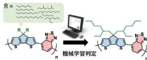
図3. 機械学習による高分子設計の例

ールの開発を目指した 3) 。まずは、これまでに学術論文で報告されている高分子フラレン太陽電池の混合膜材料の化学構造とその素子性能に関わる物性値 (分子量、電子準位など) を集め、最終的に1200個の高分子の化学構造と物性値のデータセットを収集した。機械学習では大量かつ精度の高い数値データが必要不可欠であり、このデータ収集は大変ではあるものの避けては通れない作業である。次に、これらのデータセットを基に、ランダムフォレストを用いた分類器の構築に取り組んだ。その結果、従来の計算化学では不可能であった、溶解性を付与するアルキル鎖の選別も可能になり、高分子太陽電池開発において新たな手法を確立した (図3)。今後は、n型非フラレン太陽電池や多成分太陽電池にもMIの手法を適用し、前述の高速実験スクリーニング (TRMC) 法を融合することで、高効率高分子太陽電池の開発を加速度的に進めていきたい。