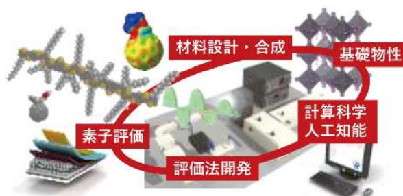
図1. 当研究室での研究概略

持続可能で安全・安心な社会の実現に向け、エネルギー変換に関わる新たな材料とデバイスの開発が世界中で行われている。この中で「化学」は、原子や分子を精密に制御することで材料の機能を最大限に発揮させ、さらに光・電気・熱エネルギーの相互変換を司る最重要学問である。我々の研究室（阪大院工・応用化学専攻・物性化学領域）では、光・電気・誘電性といったさまざまな物性の背後にある物理化学を基盤とし、エネルギー変換機構の解明、新規機能材料の開発、新たな評価装置・解析手法の開発を行っている（図1）。特に、マイクロ波と呼ばれる電磁波を使った時間分解測定を駆使して、次世代太陽電池の開発を目指している。太陽電池は光を電気に変換する素子であるが、その光電変換効率は階層構造からなる材料と積層素子の複合的な結果として得られるため、素子特性だけではメカニズムの詳細は分からない。そこで複雑系の中から、ある「切り口」に注目することで、素子の性能支配因子や基礎物性の解明が可能となり、高効率素子実現への設計指針を得ることができる。本稿では、当研究室で行っている装置開発から太陽電池の基礎物性評価、人工知能を用いた材料設計、さらには機能材料の開発について紹介する。