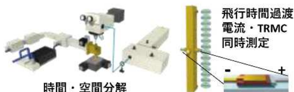
図4. 新規マイクロ波分光装置

Kでの温度制御はもちろんのこと、最近では光学顕微鏡と組み合わせた時間・空間分解評価装置 5) や、電子線加速器からの電子線パルスを励起源とする溶液中の高分子一本鎖の電荷キャリア移動度評価、さらには透明電極を含む太陽電池素子構造を共振器に挿入し、飛行時間過渡電流・TRMC同時測定による電荷キャリア移動度緩和過程の直接評価装置を独自に開発した(図4) 6) 。金属や透明電極はマイクロ波を吸収・反射するため、通常マイクロ波共振器に挿入すると共振が取れず測定は不可能である。しかし、高調波共振器を設計することでこの問題を解決し、マイクロ波分光の可能性を大きく進展することができた。他にも、ある種の有機無機ペロブスカイト材料において複素伝導度の極性が反転する異常誘電応答を見出し、波長の異なる2種類のレーザーをpump-push光として用いることで、捕捉電荷の励起を直接観測する手法も開発した 7) 。今後も、電磁波分光(主にGHz~THz)を基盤とし、新たな機能や物性を明らかにする装置と解析手法の開発を展開していく予定である。