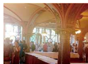
ウェルカムディナーの様子