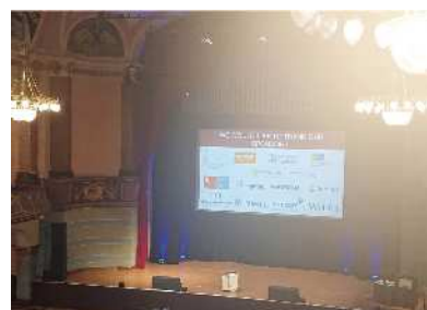
口頭発表会場の様子

1992年9月生まれ 大阪大学大学院基礎工学研究科物質創成専攻卒業 (2018年) 現在、大阪大学大学院基礎工学研究科物質創成専攻博士後期課程2年 日本学術振興会特別研究員 (DC2) 修士 (工学) 有機金属化学、有機合成化学 TEL : 06-6850-6248 FAX : 06-6850-6249 E-mail : hirai@organomet.chem.es.osaka-u.ac.jp