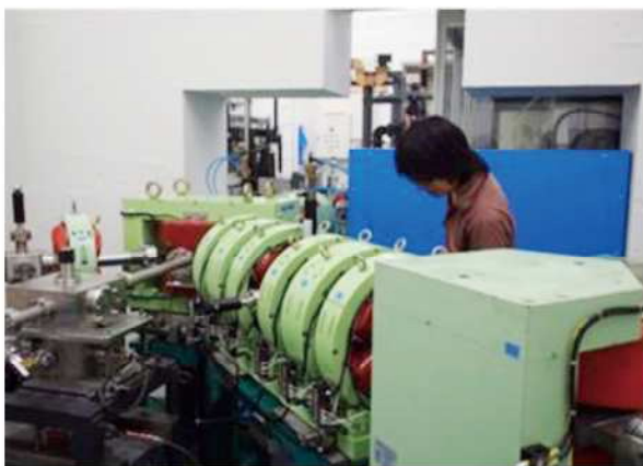
図1 フェムト秒電子ビームを発生する加速器 (大阪大学産業科学研究所量子ビーム科学研究施設)