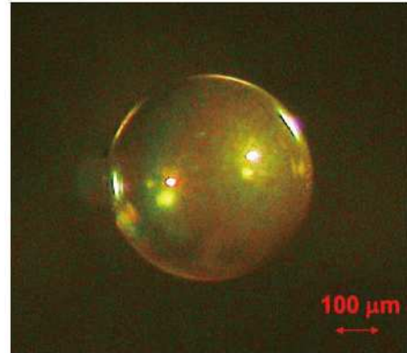
図 4 レーザー核融合燃料保持のためのダイヤモンドカプセル

おり、その解決に向けた研究が精力的にすすめられている。大阪大学ではこの流体不安定性の影響を軽減した高速点火法による核融合点火の研究をすすめ、よりコンパクトなレーザー核融合炉実現に向けた開発を行っている。