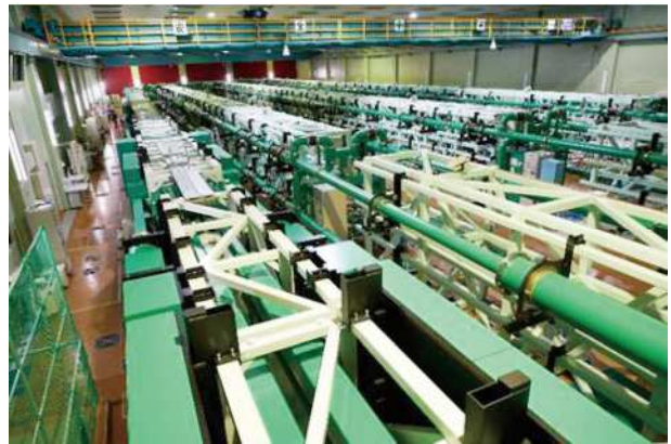
図1 大阪大学レーザー科学研究所の激光 XII 号および LFEX レーザー装置

このような装置の大型化による高出力化だけでなく、レーザー光のパルス幅（時間幅）を短くすることにより、より高いピークパワーを得るという方向性の開発も行われている。2018年にノーベル物理学賞の受賞対象であるチャープパルス増幅法により、従来よりも3桁以上のピークパワーをもつ超高強度・超短パルスレーザーの構築も可能となった。これによって相対論プラズマをはじめとするさらなる極限的な状態が得られるようになったほか、レーザー核融合の高速点火方式への活用など、より幅広い学際的な研究展開がなされている。