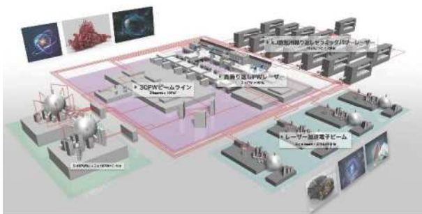
図5 パワーレーザーインテグレーションによる新共創システム：J-EPoCH計画の装置概念図

この高繰り返しパワーレーザーを用いることにより、そのショット数を飛躍的に増大させることができることから、単に沢山のデータを実験で収集することに留まらず、機械学習等の近年の知見を組み合わせることにより、新たなサイエンスの境地を切り拓くことが期待されている。その研究分野も高エネルギー密度科学や核融合の開発研究に限らず、レーザー加工や粒子加速、核科学や医療応用など、幅広い応用分野も視野に入る。以上の要素を取り入れた次世代レーザー装置が、第24期学術の大型研究計画に関するマスタープラン（マスタープラン2020）に「パワーレーザーインテグレーションによる新共創システム：J-EPoCH計画」として提案されており、その実現に向けた取り組みが進められている。