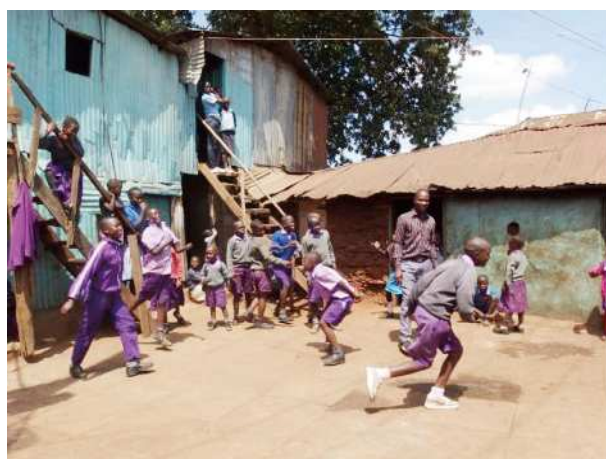
図3 閉鎖を余儀なくされたスラム内の私立学校

閉鎖期間中の子どもの学習を支える手立てとして、オンライン学習などがあるが、ラジオやスマートフォンを利用するもので、ごく一部の恵まれた家庭の子どもが対象となっているに過ぎない。また、公立学校に勤める政府雇用の教員にとっては、給与は保障されているので経済的な問題はないが、私立学校にとっては深刻である。スラムの中にある低学費私立学校は、自転車操業が普通であり、授業料がほぼ唯一の収入である。特に校舎を借りて運営している場合、学校が閉鎖され、収入がなくなれば、即刻、経営は続けられなくなる(図3)。そして、教師は失職し、路頭に迷うことになる。筆者が懇意にしているスラムの学校の校長や教師からは、4月半ばになり、もう食べ物がない、自宅の家賃が払えないなどのメールやSNSが届いた。