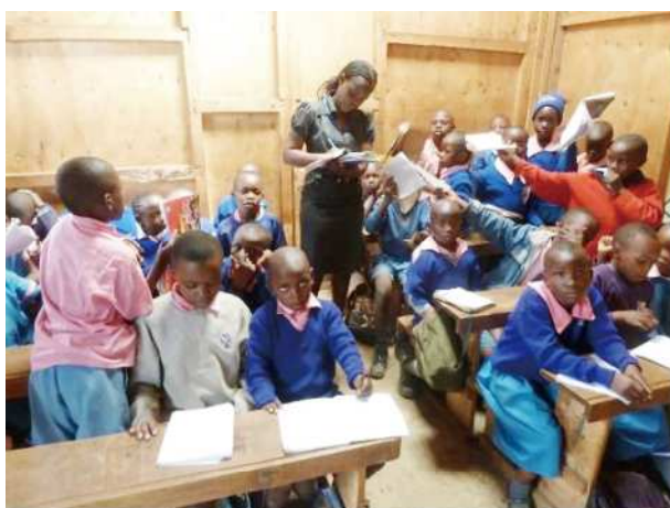
図2 スラム内の私立学校での授業風景

スラムで筆者が調査を行った3校は、2006年から2009年に設立され、生徒数は100~350人、教員数は9~14人である(澤村2015)。月額授業料は4~5ドル、教員給与は月額30~60ドルで、これは政府雇用教員の5分の1程度である。これらの学校は、いずれもスラムに住む個人の意志で始められている。政府による教育の提供が行き届かない地域では、人々は自ら行動を起こし、学校をつくり、自律的な運営を行っている。働く教員も同じコミュニティ出身であり、生徒や親・保護者との連帯感が強いことも特徴である。長らくケニアの公立学校で調査していた筆者にとって、教員の生徒に対する親近感と責任感に驚かされる(図2)。スラムの中にあるからこそ、土地・建物に大きな費用がかからず、効率的な学校経営が可能となっている面もある。