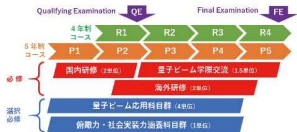
図 3. PQBA のカリキュラム概要

高度な専門性は各研究科における研究活動を通じて涵養され、その研究対象は量子ビームに限定されないことに留意いただきたい。多分野を俯瞰する力は、量子ビーム応用科目、俯瞰力・社会実装力涵養科目や、指導教員以外の二人のメンターによる指導を通じて獲得できる。さらに PQBA 生には、高い国際通用力を身につけることにより、「知のプロフェッショナル」として国際的なリーダーとなって活躍することを期待している。