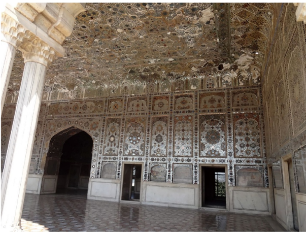
鏡の間 蝋燭一本で部屋全体がほの明るくなる (ラーホール)

礼拝の声を拡声させる役割、壁一面に小さな鏡を埋め込んだ宮殿で蝋燭1本を灯せば全ての鏡に光が映り込み、熱帯夜のなか最小限の炎で部屋がほの明るくなる技術など、着想力に富んでいる。