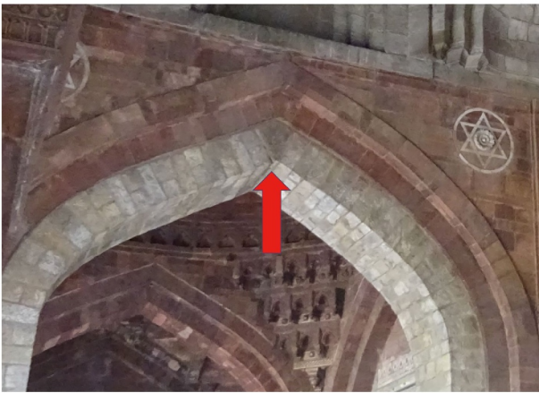
アーチ式建造物 頂点に楔を打ち込んでいる (デリー) くさび