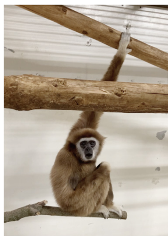
図1 研究室で飼育しているシロテテナガザル (オス)

伝子によらない非生物学的な影響が少なからずある。我々の研究室では、進化の隣人たるサル類との比較を通して、その幾重にも重なった鎧を剥ぎ取って、生物としてのヒトの本性を抽出しようとしている。ちょうど、日本文化を理解するのに、お隣の韓国や中国、欧米の文化などと比較するのと同じアプローチである。猿山でサルを眺めていると、ここかしこにヒトらしさが垣間見えて楽しい。そこからさらに比較を深めて、サル類とヒトとの共通点と相違点を整理して、その知見を系統樹の上に置いていくと、ヒトの生物学的特性とその進化の歩みが理解できる。